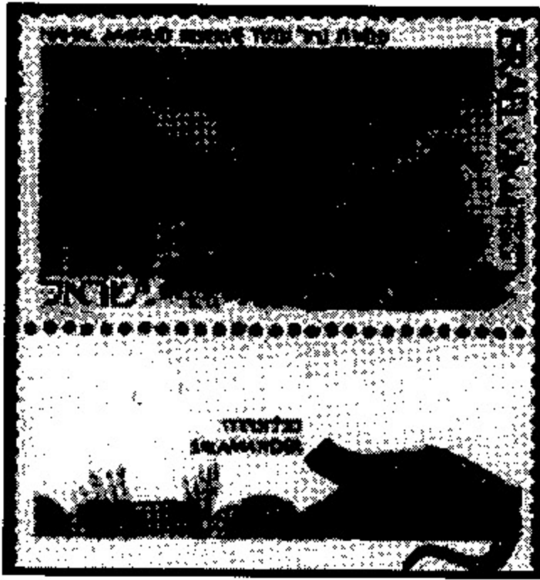
שמונת הטבע הנחל עמוד. המערה שבתחומה עשירה במצאי אדם קדמון.

לנו כישראלים יש עניין מיוחד באדם הקדמון בזכות מגוון ממצאים שהתגלו בארץ - ממצאי נחל עמוד (שבזכותם מוכר במדע תת-מין של האדם שקרוי בין החוקרים "אדם עמוד") וממערות האדם הקדמון בנחל המערות שבהר הכרמל (תת מין "ארצישראלי" נוסף הידוע כ"אדם הר הכרמל"). ישנה אפילו תרבות חומרית שלמה של כלי אבן של האדם הקדמון הקרויה "התרבות הנטופית" בזכות הממצאים מבקעת בית נטופה המובילה מצפון מזרח אל נחל המערות - אתר טיול רגלי מומלץ לכל אוהבי הארץ בימי האביב. למרבית הצער השירות הבולאי עוד לא הנפיק בולים או פריטים אחרים המציגים את מקומה של ארצנו בהיסטוריה האנושית הקדומה.